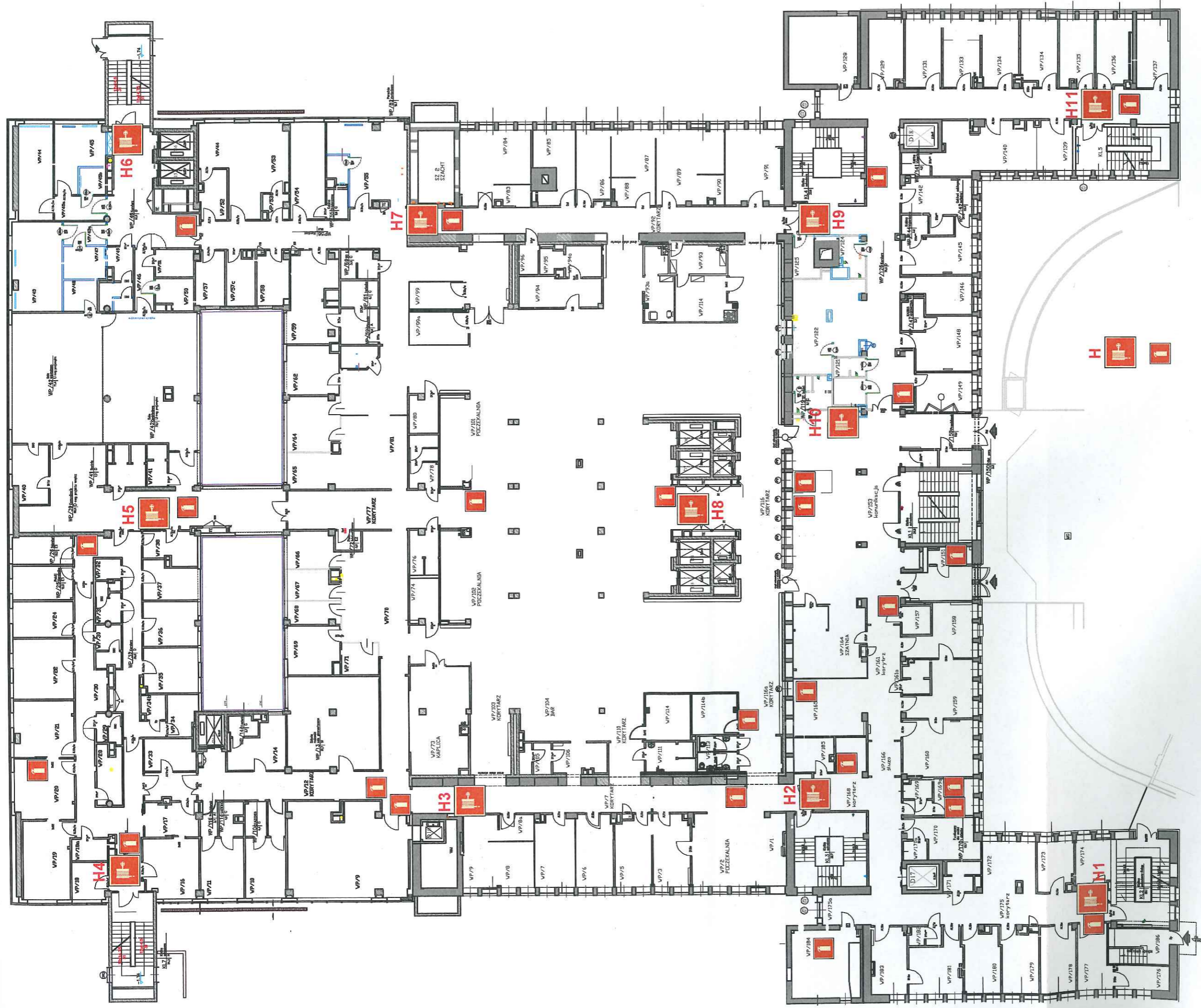
RYСУNEK NR 4/2020