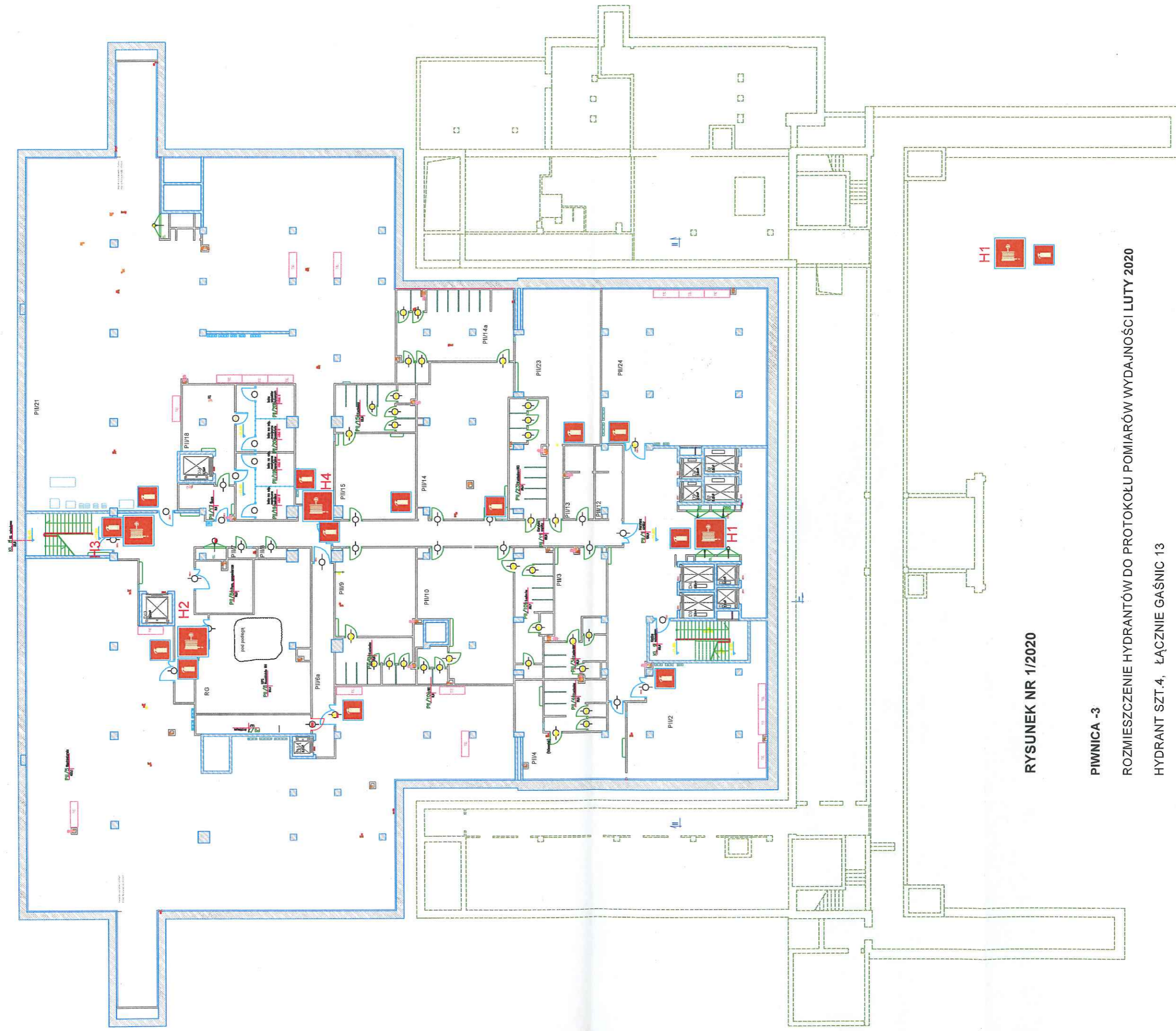
RYСУNEK NR 1/2020