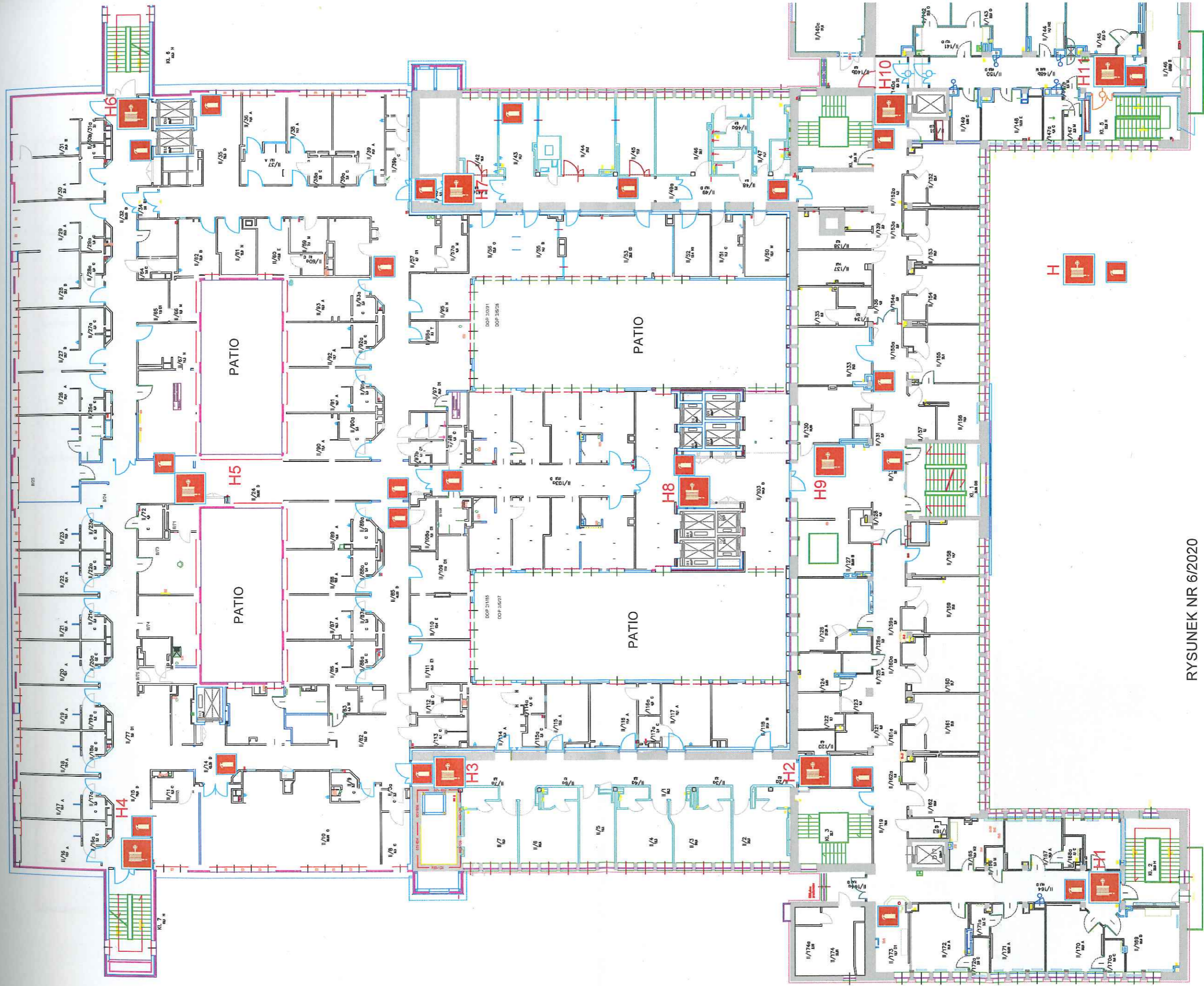
RYSUNEK NR 6/2020